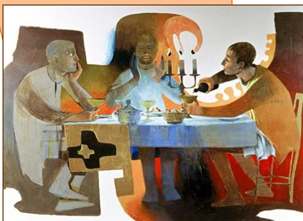
ARCABAS - EMMAUS